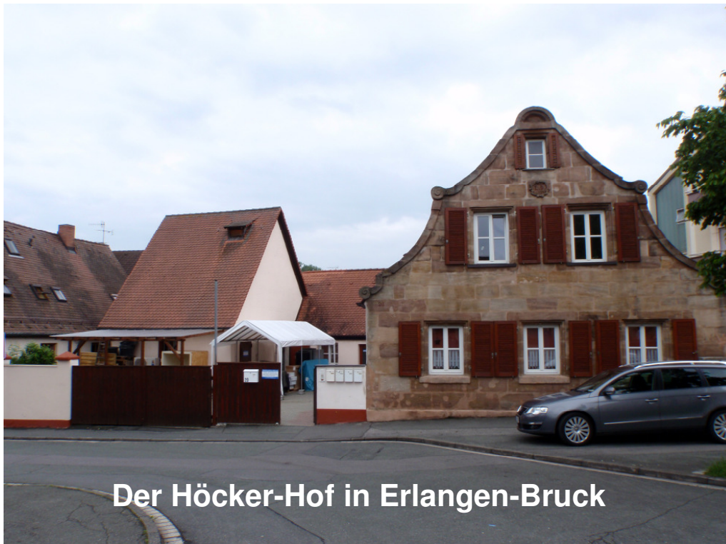
Der Höcker-Hof in Erlangen-Bruck

Historisches Gebäude um 1670, Denkmalschutz Sandstein und Fachwerk, 250 m 2 beheizt mit cop-star-Wärmepumpe und normalen Heizkörpern! Besichtigung möglich Anmeldung: 09131-685268